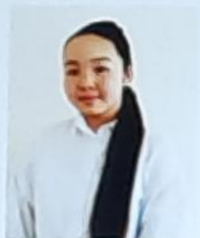
Кувөлүк министри Мырзагулова Асема