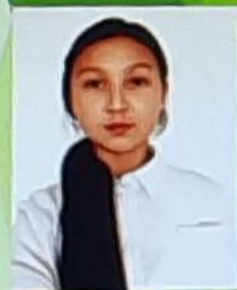
Окуу министри Шамирова Айлай