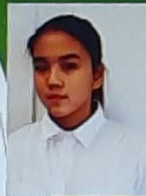
Тартип министри Асылбекова Феруза