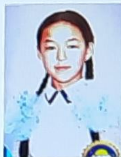
Маданият министри Тороканова Севил