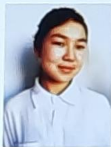
Китеп министри Мамбеталиева Нурсел