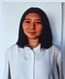
Пример министр Усенбекова Арзыкан