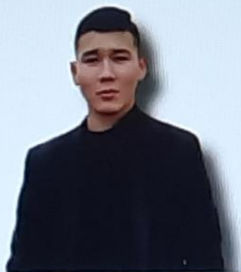
Президент Мырзагулов Нурлик