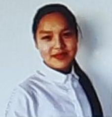
Тазалык министри Джангазиева Камина