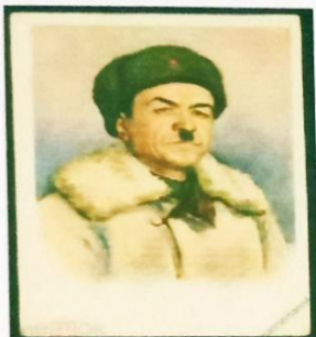
Иван Васильевич Панфилов

316 – аткычтар дивизиясынын командири. Анын дивизиясы Москваны коргоодо эрдик көрсөткөндүгү үчүн «Кызыл Жылдыз» ордени менен сыйланган.