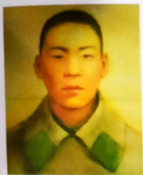
Советтер союзунун баатыры ЧОЛПОНБАЙ ТҮЛӨБЕРДИЕВ

Воронеждин түштүк жагында Дон дарыясынын жээгиндеги согушта 1942 – жылы 6 – август Чолпонбай Түлөбердиев душмандын дзотун көкүрөгү менен жаап, өлбөс- өчпөс эрдикти көрсөткөн. Ага 1943 – жылы 4 - февралда Советтер Союзунун Баатыры деген наам берилген.