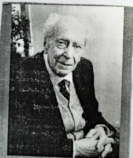
Лихачев Д. С. «Раздумья»